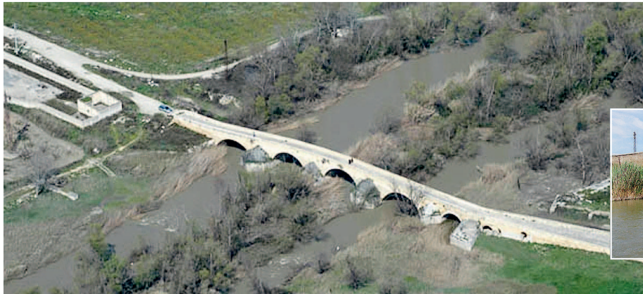
PONTE ROMANO Una suggestiva immagine del ponte dall'archivio dell'agenzia territoriale per l'Ambiente